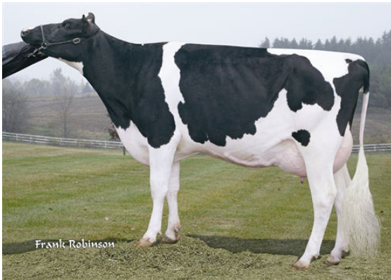
HOL-STAR OUTSIDE TEREÉ FOURTH DAM